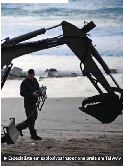
▶ Especialista em explosivos inspeciona praia em Tel Aviv